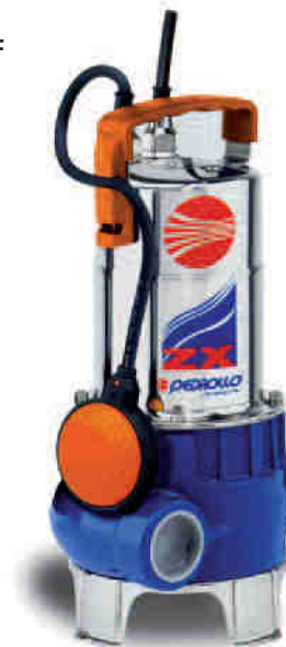
TABLA DE PRESTACIONES 2.900 rpm

CE, según EN 60 335-1, EN 60034-1, IEC 335-1, IEC 34-1, CEI 61-150 y CEI 2-3